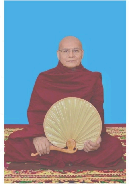
ရှင်းတမ်းကျမ်းပြုဆရာတော် ဘဒ္ဒန္တမုနိနာဘိဝံသ