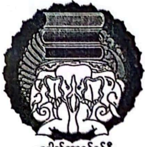
ဒေါက်တာခင်ခင်ရီ ပရိယတ္တိဖောင်ဒေးရှင်း